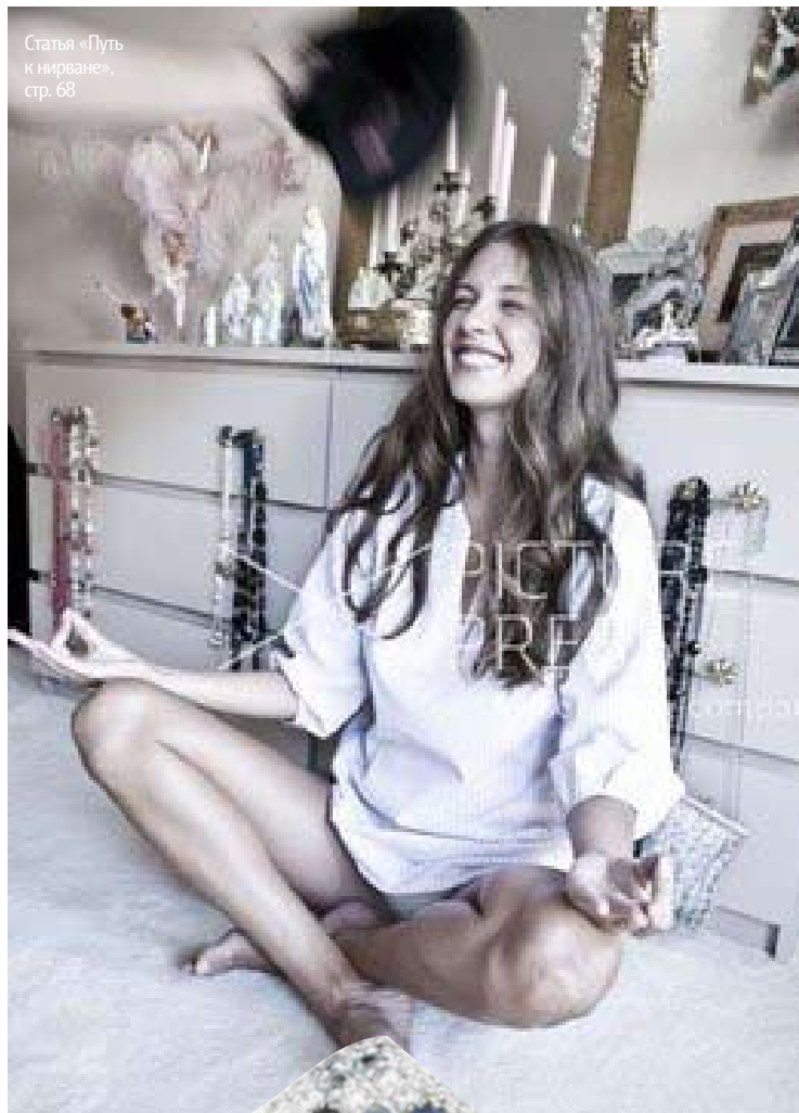
Статья «Путь к нирване», стр. 68